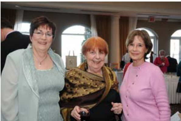
Les cofondatrices du Nichoir